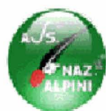
A.N.A. - SEDE NAZIONALE