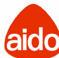
GRUPPO AIDO LACCHIARELLA